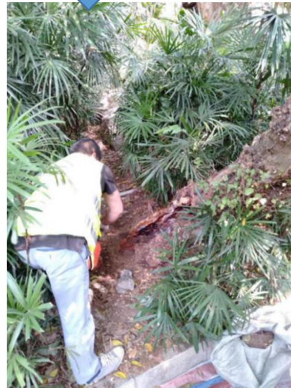
树洞干燥防尘、内部防腐