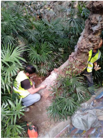
用新型材料做内部填充造型