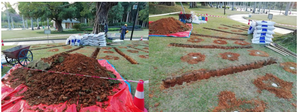
古树根部复壮沟复壮作业

在古树冠幅投影范围内挖掘复壮沟，沟长宽高为 300cm*30cm*30cm，将原土挖出清运，然后淋施复壮生根药剂“飘绿块跟”、复壮液体肥“飘绿 8 号肥”，回填复壮基质。增加古树根系的透水透气性，也达到疏松土壤、深耕施肥的作用，促进古树生长。