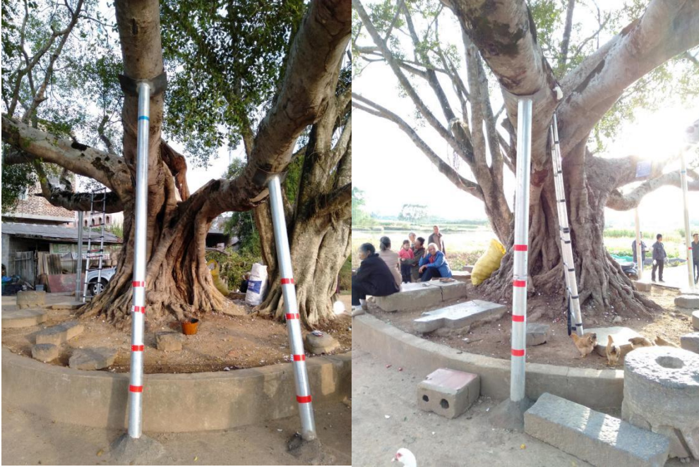
古榕树腐朽分枝修筑钢管支撑