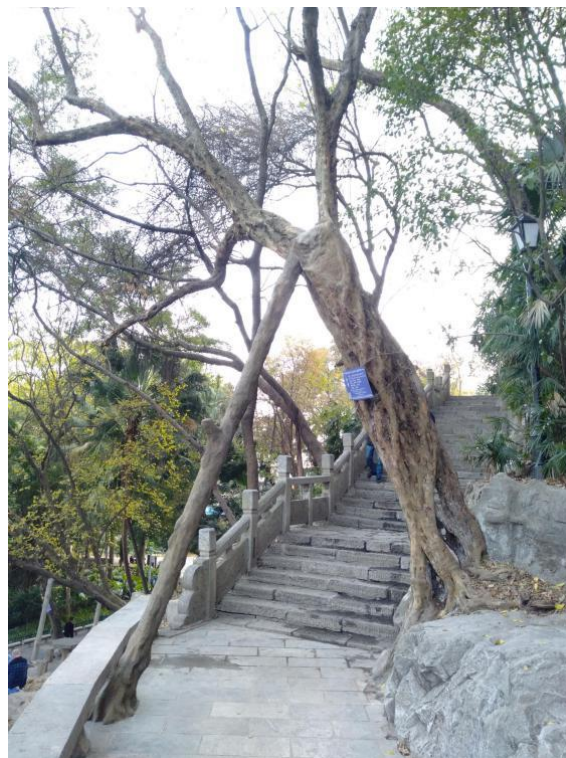
青檀古树长势倾斜修筑仿木支撑