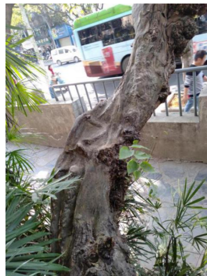
表面封补与树皮近似的新型材料, 达到整洁美观的效果