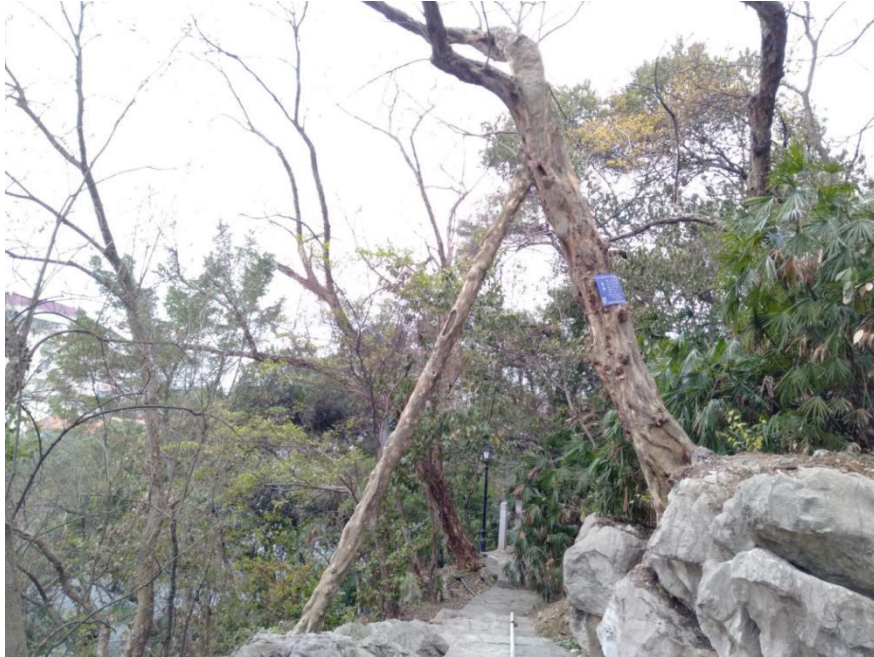
青檀古树长势倾斜修筑仿木支撑