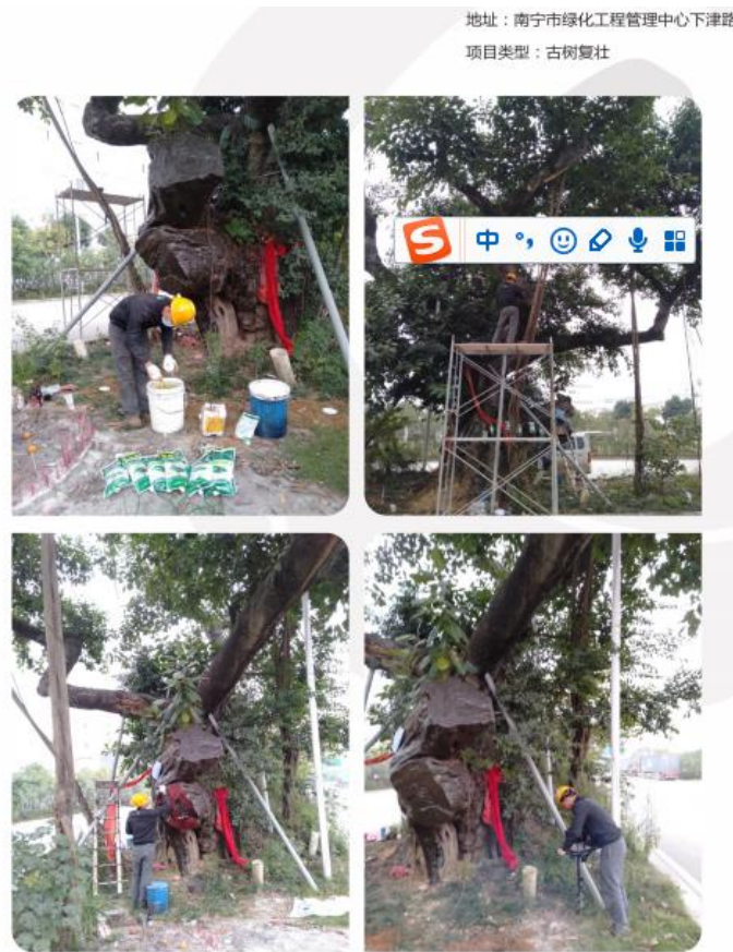
古树根部透气孔复壮作业

在古树冠幅投影范围内采用专业打孔机打透气孔，淋施古树专用肥料，增加古树根系的透水透气性，也达到疏松土壤、深耕施肥的作用，促进古树生长。