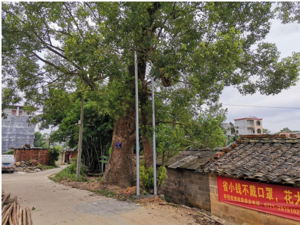
古樟树因腐朽树洞及长势倾斜“A”字型支撑